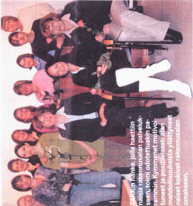
TAKK:n hänke, jolla haettiin naisia rakennusalan palvelukseen, toimi odotettuaakin paremmin. Kymmenet motivoituneet ja positiivisesti alan mahdollisuuksista yllyttäneet naiset kokivat rakennusalan omakseen.

Lainsäädäntöön vaikuttaminen on tärkeää "Haluaisin, että saisimme ACE:ssa aikaan parannuksia